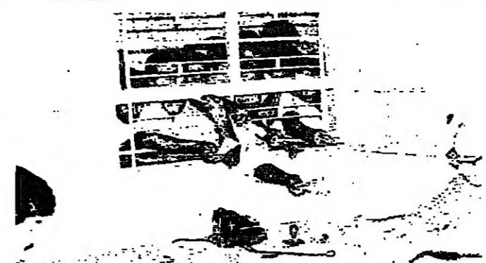
موظف واحد .. وشباك واحد .. ومشرات الأيدي